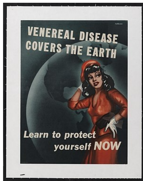
Informační plakát v boji proti STD