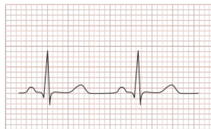
Nomální křivka EKG – fyziologická doba jednotlivých vln, úseků a intervalů