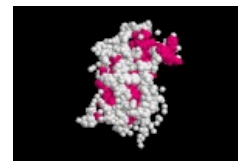
Struktura růstového hormonu

Růstový hormon (somatotropin, somatotropní hormon, STH, growth hormone, GH) je lineární polypeptid o 191 aminokyselinách se dvěma vnitřními disulfidickými můstky a M_r 21 500. Z růstových hormonů jiných savců se mu imunologicky a chemicky blíží jen STH opičí. Ten je také jediný u člověka biologicky účinný, ostatní jsou zcela neúčinné. Somatotropin vzniká z většího prekurzoru o M_r 28 000, tzv. pre-STH (pre-GH), který se také secernuje do krve, ale nemá fyziologický účinek. STH je syntetizovaný a secernovaný v adenohypofyzárních somatotropech, které tvoří přibližně 50 % buněk adenohypofýzy a (spolu s laktotropy) patří mezi acidofilní sekreční buňky předního laloku hypofýzy, barví se kyselými barvivy (např. eosinem).