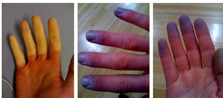
Barevné změny prstů ruky

www.nutraceutica.sk/sk/nutraceutika_pri_ochoreniach/raynaudov_syndrom.aspx )