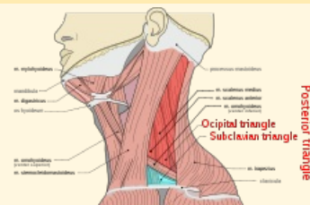
regio cervicalis lateralis

Ohraničení přední okraj musculus dorzálně trapezius