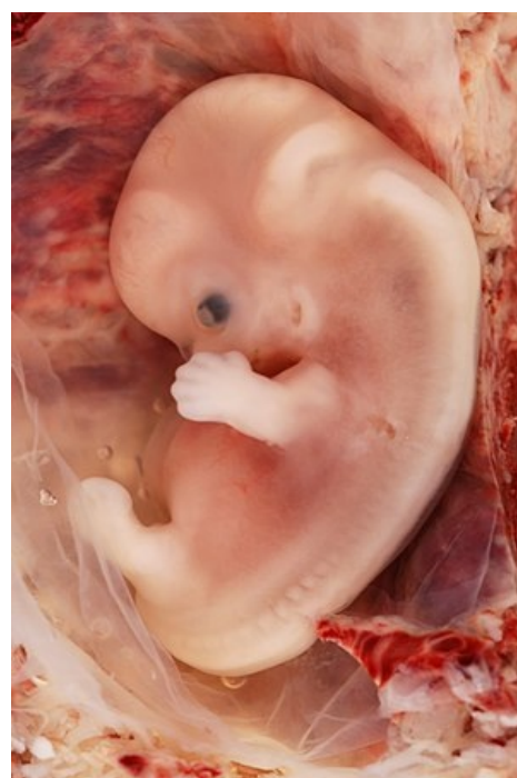
9týdenní lidský plod při mimoděložním těhotenství.