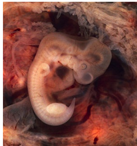
7týdenní lidské embryo při mimoděložním těhotenství.