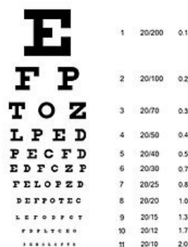
Snellenova tabule, jeden z používaných optotypů

Ostrost je ovlivňována faktory fyzikálními (vadami optického aparátu), fyziologickými (adaptace oka na intenzitu nebo sílu světla, rozložení smyslových elementů) a psychologickými (pozornost). Při zvyšování intenzity osvětlení do 100 luxů kvalita zrakové ostrosti stoupá, do 1000 luxů zůstává konstantní. Při vyšší intenzitě osvětlení klesá kvůli oslnění. Zraková ostrost klesá směrem od centra sítnice do její periferie, kde je menší hustota smyslových elementů a jednomu odvodnému vláknu odpovídá více tyčinek a čípků.