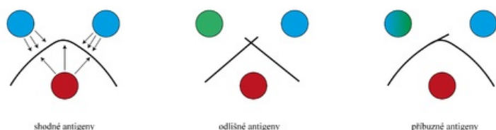
Možné výsledky precipitace v gelu