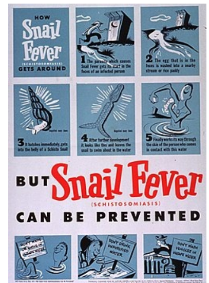
Plakát varující před schistosomiázou