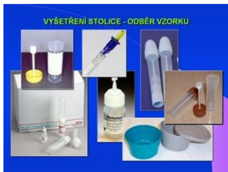
Vyšetření stolice – odběr vzorku

Screeningové (vyhledávací) programy jsou zaměřeny na časnou diagnostiku onemocnění, které jinak zůstávají, v této časné fázi, nerozpoznány. Screeningové programy se provádějí u asymptomatických osob (bez příznaků onemocnění). U definovaných tzv. vysokorizikových skupin se jedná o programy dispensarizační. Pro tyto vyhledávací programy se musí přesně definovat populace, která má být screeningem testována, interpretace použitých testů a způsob dalšího vyšetření resp. léčby při pozitivním výsledku testu. Gastroenterologický screening, který zahrnuje tři základní programy, lze provést ze vzorku stolice .