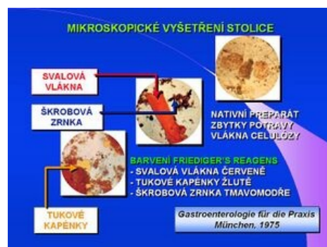
Mikroskopické vyšetření stolice

která může být aktivována graviditou a přináší zvýšené riziko malignit gastrointestinálního traktu, je možný detekcí sekrečních IgA protilátek ke gliadinu nebo průkazem protilátek ke tkáňové transglutamináze ve stolici.