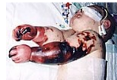
Rozsáhlé sufuze mohou být komplikovány gangrény, které někdy vedou až k amputaci končetin.