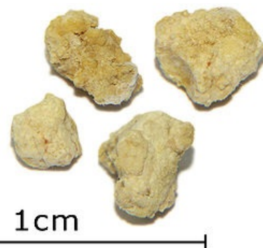
Sialolitiáza – slinné konkrementy