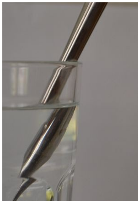
Lom světla ve vodě

Jelikož s rostoucím úhlem dopadu roste úhel lomu, při určitém úhlu \alpha , který se nazývá mezní úhel , již k lomu nedochází a vzniká úplný odraz. Měřením mezního úhlu můžeme určit index lomu dané látky, čehož využívají přístroje zvané refraktometry.