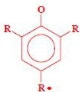
A• (radikál antioxidantu)