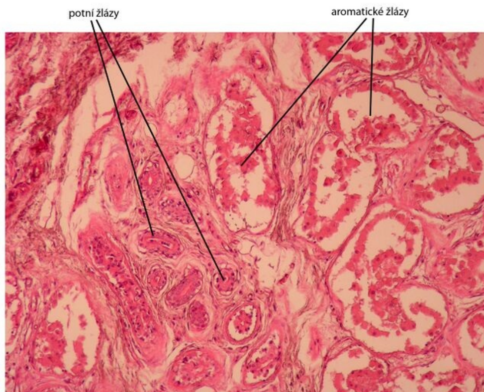
Axilla - kožní žlázy, barveno H&E