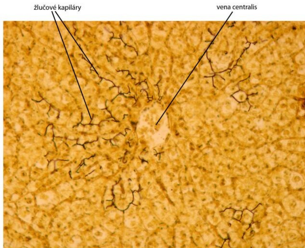
Játra (hepar) - impregnace žlučových kapilár