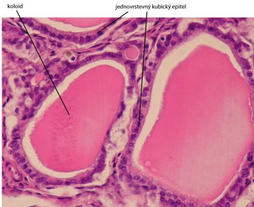
Jednovrstevný kubický epitel - folikulární buňky - preparát štítná žláza, barveno H&E