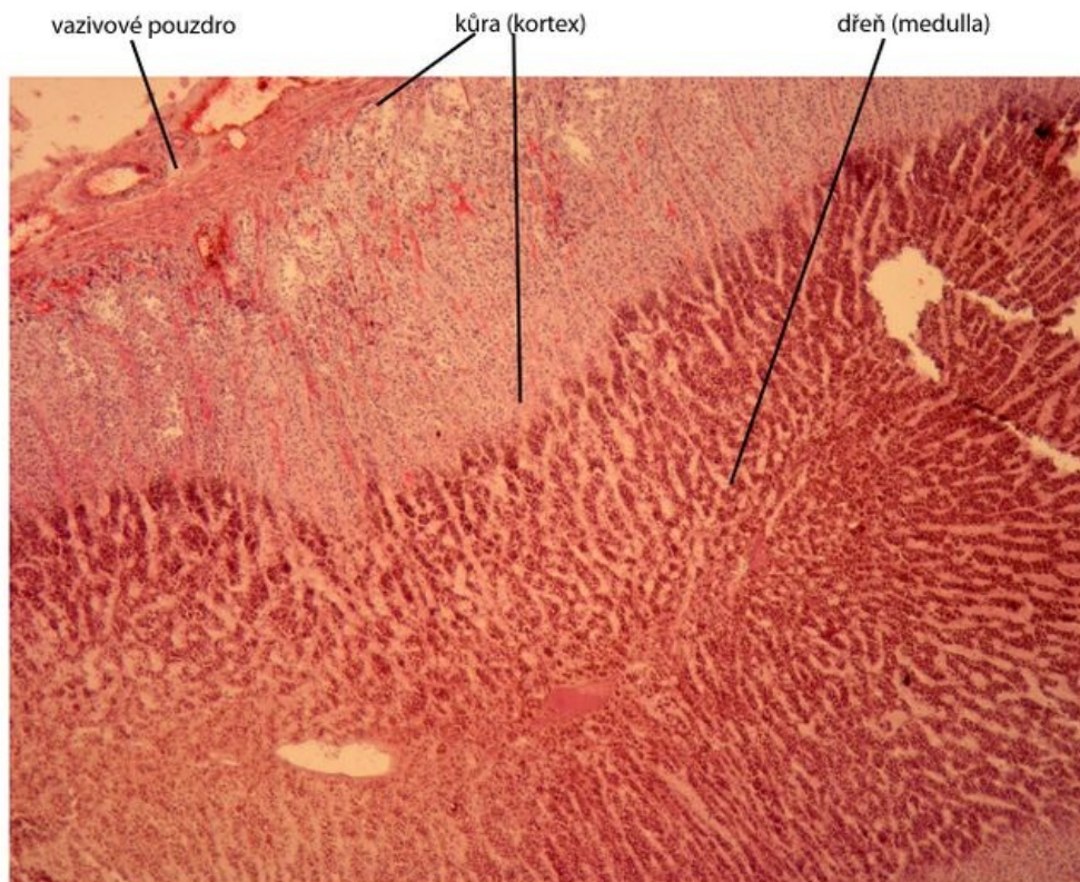
Nadledvina (glandula suprarenalis) - barveno H&E