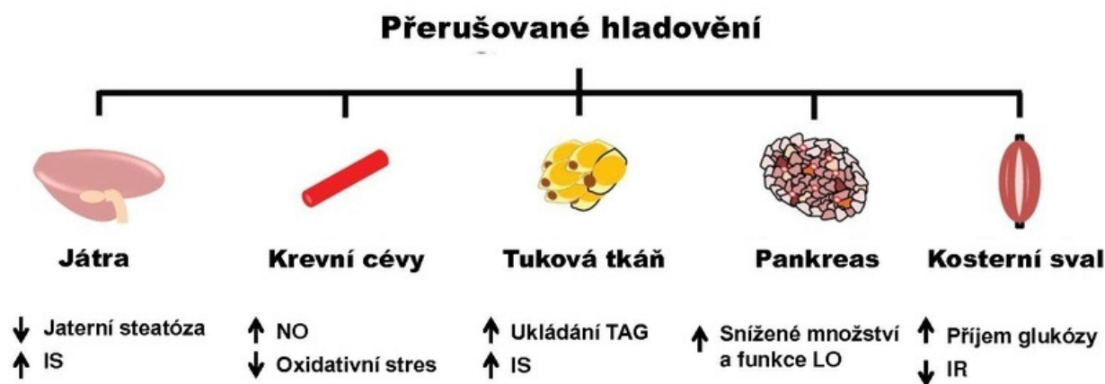
Obr. 1. Tkáňově-specifický efekt přerušovaného hladovění IS - Inzulínová senzitivita, NO - Oxid dusnatý, TAG - Triacylglyceroly, LO – Langerhansovy ostrůvky, IR - Inzulínová rezistence (Převzato a upraveno z Brown et al., 2013)

Size of this JPG preview of this PDF file: 800 × 600 pixels.