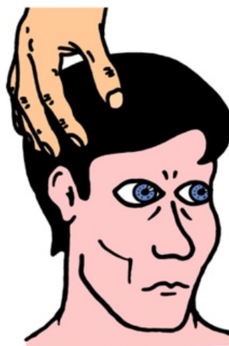
kmenová léze bulby se točí spolu s hlavou