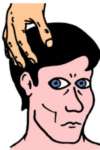
neporušený kmen deviace bulbů proti směru pohybu hlavy