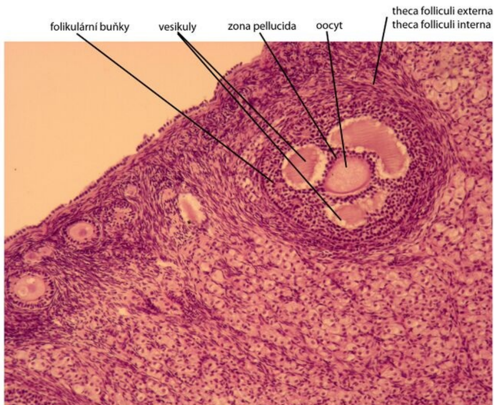
Sekundární folikul - preparát ovárium, barveno H&E