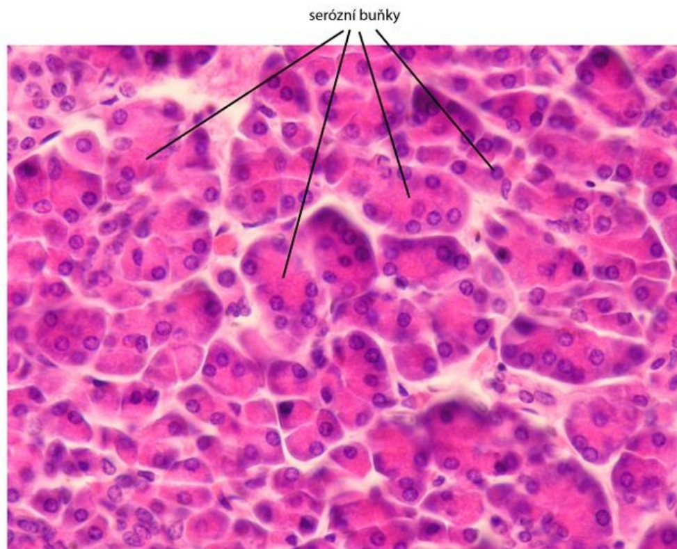
Serózní buňka - preparát pankreas, barveno H&E