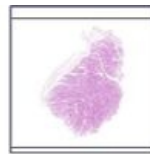
Svalové vřeténko / Muscle spindle: