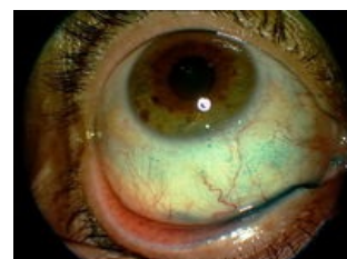
Obarvení lisaminovou zelení

Objektivně vidíme zarudnutí z překrvení spojivek s lokalizovaným prosáknutím , absence či zmenšení menisků, přítomnost spojivkových řas v důsledku tření i jemná vlákénka na povrchu spojivky a rohovky, možná je i přítomnost lepkavé sekrece . Postupně dochází k objektivnímu poškození povrchu očí začínajícímu drobnými oděrkami, které ale mohou postupně přejít do chronického zánětu rohovky a spojivky . V nejhorším případě ztrácí rohovka postupně průhlednost , zhoršuje se vidění, a pokud se tento stav nijak neřeší, může dojít až k oslepnutí .