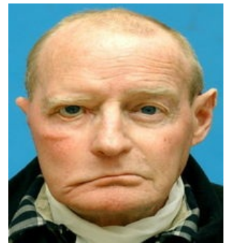
Periferní paréza N.VII. – lagophthalmus

Některé léky – antihistaminika, vazodilatancia, diuretika, atropinové preparáty, alkohol, p.o. steroidy, antiglaukomatika, dlouhodobé užívání vazokonstrikčních očních kapek .