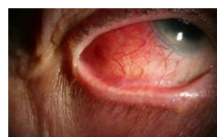
Oční jizevnatý pemphigoid

Hlenová vrstva bývá poškozena při karenci vitamínu A ( xerofthalmie , přítomné keratinizující buňky), při chemickém i fyzikálním poškození pohárkových buněk , u trachomu i pemphigoidu. Dochází k nestabilitě slzného filmu, vytváří se Bitotovy skvrny .