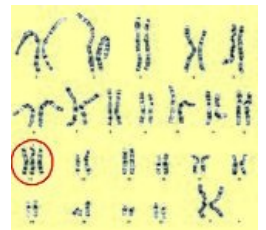
Karyotyp u Patauova syndromu