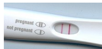
Pozitivní těhotenský test

K oplození vajíčka dochází v období "plodných dnů", což je průměru asi 3 dny před a 3 dny po ovulaci (14. den cyklu). Tento údaj se však u každé ženy liší v závislosti na délce cyklu, menstruace apod. K oplození nejčastěji dochází v oblasti tuby. Oplozená zygotička následně putuje směrem do děložního těla, kde se implantuje v oblasti děložní sliznice. Implantované embryo začne produkovat hormon hCG (choriongonadotropin), který zajišťuje stimulaci žlutého tělíska (produkce progesteronu a estrogenů), které je nezbytné pro udržení a vývoj těhotenství do 5.-7. týdne (progesteron) a zároveň k navození fyziologických změn v těle matky (estrogeny).