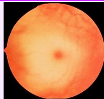
Třešňová skvrna na sítnici