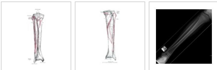
Přední strana tibie