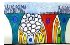
Epitel dýchacích cest

Vrstva velmi buněčného řidkého kolagenního vaziva obsahuje cévy , nemyelinizované nervy a seromucinózní žlázy . Přítomny jsou též více či méně četné plazmatické buňky a lymfocyty , které dokonce mohou tvořit folikuly (BALT).