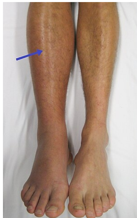
Otok pravé dolní končetiny, lividní zabarvení