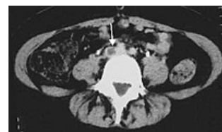
CT hluboké žilní trombózy ve v. iliaca communis

Podrobnější informace naleznete na stránce Antikoagulancia.