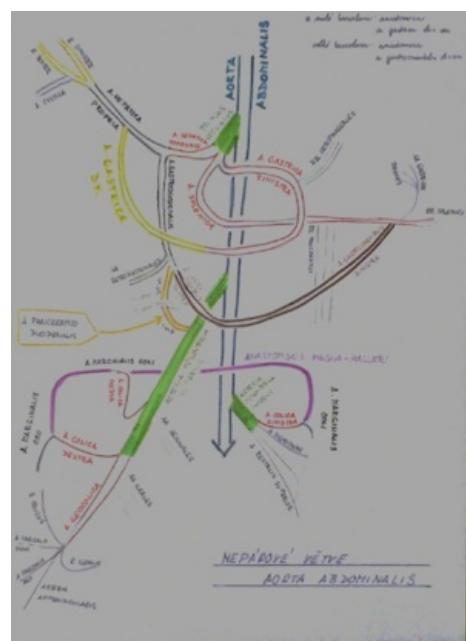
Nepárové větve břišní aorty

Konečné větve AGS (rr. oesophagei), AHC (a. hepatica propria, a. gastroduodenalis → aa. retroduodenales), AS (a. gastroomentalis, a. gastroepiploica sinistra, aa. gastricae breves, a. gastrica post., rr. pancreatici)