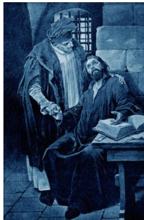
Věnceslav Černý - Křišťan z Prachatic návštěvou mistra Jana Husi