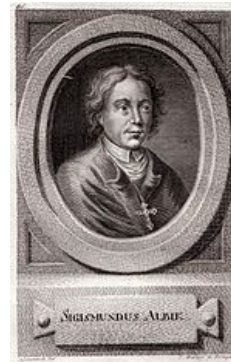
Albík z Uničova