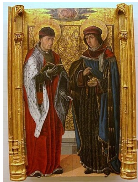
Sv. Kosmas a sv. Damián

Mezi další významné profesory prvních desetiletí lékařské fakulty patřili: