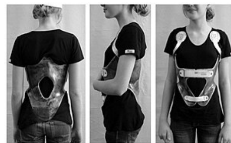
Korzet ke korekci kyfózy