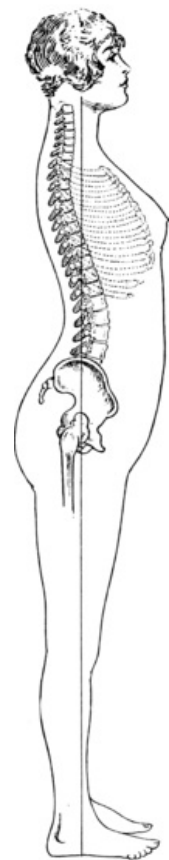
Spuštěná olovnice v prodloužení zvukovodu u zdravého držení

Vyšetření vadného držení těla můžeme rozdělit na statická nebo dynamická vyšetření. Mnohem častěji jsou používána vyšetření statická, jelikož jsou rychlá a také často bývají mnohem přesnější.