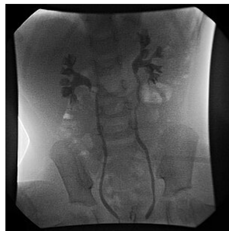
Vezikoureterální reflux III.stupně, MCUG

Video v angličtině, definice, patogeneze, příznaky, komplikace, léčba.