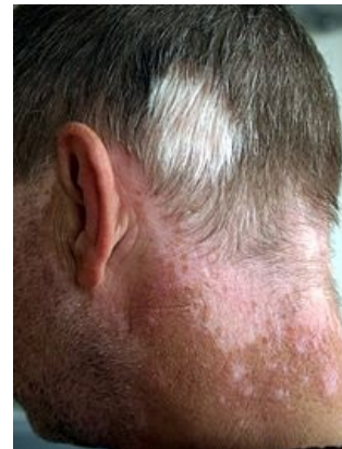
Depigmentace vlasů a kůže na krku (muž – 48 let)