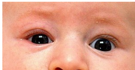
Dítě s blepharitis na pravém oku

Při této formě blefaritidy pozorujeme tvorbu šupinek mezi řasami a překrvení celého okraje víček. Probíhá jako chronický zánět provázený svěděním, pálením a únavou očí. Na kůži víček se často projeví seborhoický ekzém. Příčinou často bývá nekorigovaná nebo špatně korigovaná refrakční vada. Skvamózní blefaritidu pozorujeme častěji u diabetiků, u pacientů s chronickým onemocněním ledvin nebo se záněty trávicí trubice. Zhoršení hyperémie se projevuje v zakouřených, chladných nebo naopak teplých prostorách.