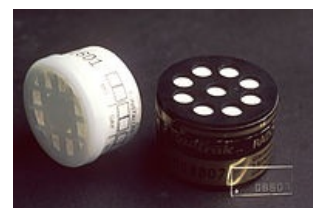
„Radon test kit“

K měření užíváme detektory záření \alpha . V domech může být i \gamma a \beta záření – jejich měření se neprovádí (aktivity většinou nedosahují rizikových hodnot).