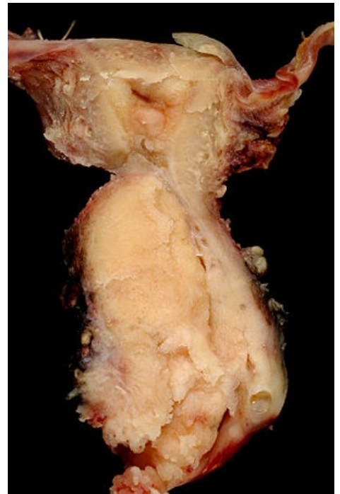
Spinocelulární karcinom děložního hrdla