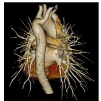
CT 3D rekonstrukce arteria lusoria

Odstupuje z aortálního oblouku Pokračuje jako aberantní odstup pravé a. subclavie