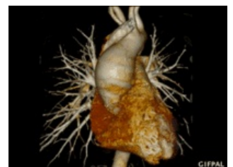
CT 3D rekonstrukce a. lusoria - animace