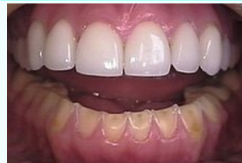
Orální manifestace bulimie