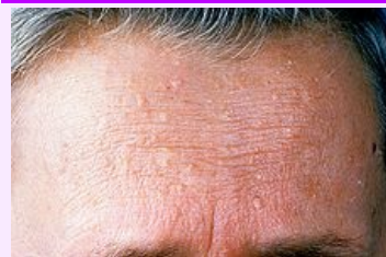
Trichilemomy na čele