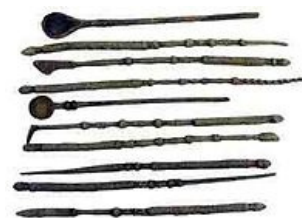
Medicínské nástroje používané starověkými Egyptany

Egyptané přispěli k mechanickým způsobům léčení poranění. Používali se dlahy k znehybnění poraněné končetiny a tak zabraňovali dalšímu poškození. Snažili se také přiblížit k sobě okraje rány a sešít je jehlou a vláknem, fixovat je k sobě klovatinou a proužky bavlněné tkaniny (primitivní Steristrip). Rány také „sešivali“ pomocí obřích mravenců. V tomto případě se mravenec přiložil k ráně, jejíž okraje byly přitaženy k sobě navzájem a když se mravenec zakousl, tělo bylo odkrouceno. Je doloženo několik pomocníků lékaře, kteří se starali o raněné na staveništích – přikládali dlahy na zlomené končetiny, ošetřovali kousnutí štírem, pohybovali se na staveništích a zasahovali, když bylo třeba. Lehčí zranění – první den se přikládal obvaz z čerstvého masa a v následujících dnech obvaz ze směsice sádla, medu a rostlinných tamponů. Poranění nadobočnicového oblouku se sešivalo Iněnou nití nebo jemnými pásky ze zvířecích střev. Zlomeniny a vykloubeniny se léčily jako dnes: nejprve se reponovaly a poté znehybnily pomocí dřevěných dlah a obinadel.