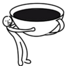
Řád černé kávy