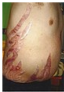
Strie u Cushingova syndromu