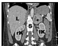
Koronární CT – Feochromocytom označen hvězdičkou