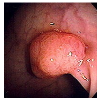
Koloskopie – polyp