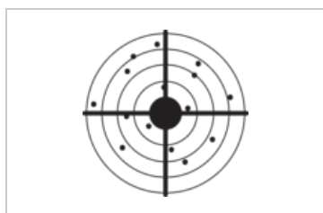
Obr. 8.3a Nízká reliabilita , tudíž nízká validita