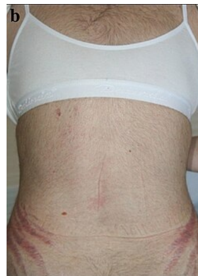
Cushingův syndrom - typické strie a nadměrné ochlupení