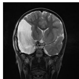
Arachnoidální cysta způsobující přesun středových struktur mozku na MRI

🔍 Podrobnější informace naleznete na stránce Edém mozku.