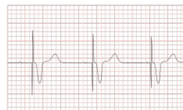
EKG-obraz pacienta s pacemakerem

Pacienti se zavedeným kardiostimulátorem dochází na pravidelné kontroly do arytmologické ambulance , kde dochází ke kontrole funkce kardiostimulátoru a po určité době je doporučena výměna baterie. Pacienti s kardiostimulátorem mají typické EKG („svíslé čárky“) deklarující impulzy stimulátoru.