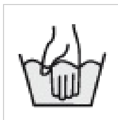
Washsym handw... 50 × 50; 4 KB